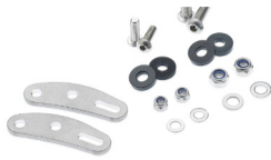
Fussverlängerung Hinterradträger Art. 70024