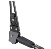
Ständer für Lowrider mit Adapterplatte Art. 73000