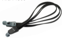
Spanngurt 3-fach „tubus“ Art. 75050