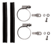
LM-BF Montageset für Gabeln ohne Ösen Art. 72200