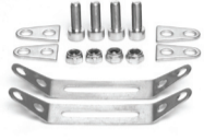
Schellen-Adapterset Art. 71614 / Art. 71616 Art. 71618 / Art. 71621 Art. 71624