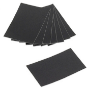
Kratzschutzfolien-Set Art. 79000