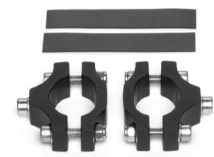
LM-1 Montageset für Gabeln ohne Ösen Art. 72100