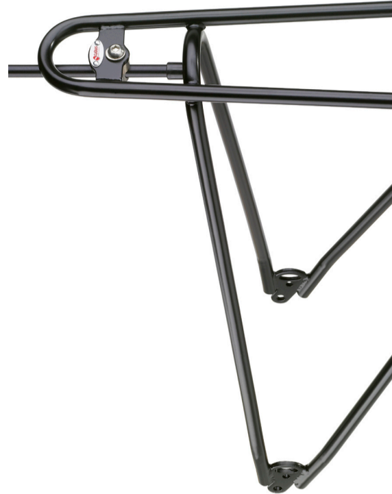
26" / 28" Art. 40000 (Schwarz / black / noir)