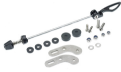
Für Montage des HR-Trägers am Ausfallende ohne Ösen. Schnellspanner-Adapter HR-Träger Art. 71500