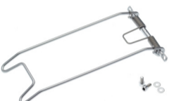
Federklappe Cargo Edelstahl Art. 70014 oder Art. 70017 für Locc oder Art. 70023 für Logo